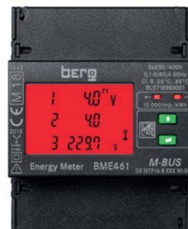
Installationsfehler erkennbar durch Farbumschlag im Display