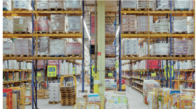
Alles für den täglichen Bedarf aus dem Hochlager der REWE Dortmund

Bevor er mittels der Berichtsfunktion übersichtliche, monatliche Reports und Verbrauchsdiagramme verschickt, checkt der Energiemanager über sein persönliches Dashboard die jeweiligen Energiekosten nur noch auf Plausibilität. Dann gehen die Informationen an die unterschiedlichen Verbrauchsbereiche Trockensortiment, Frisch- und Kühlschranksdienst sowie Produktion Fleischwerk.