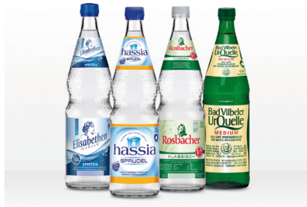
Die Hassia Markenwelt ist erfrischend vielfältig