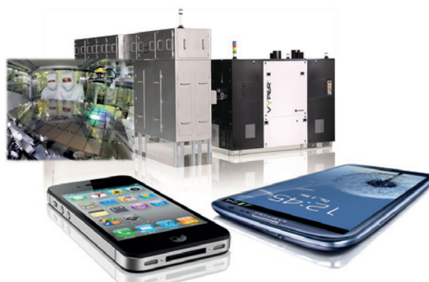
Die Laserprodukte von Coherent bieten leistungsstarke und vielseitige Lichtquellen z.B. für die Oberflächenbearbeitung von Displays

Als Energiemanagementsystem-Beauftragter hat er seit Ende 2016 nun den vollen Überblick über alle elektrischen Verbräuche und Kosten der einzelnen Werke. „Auch wenn unsere Standorte nur schwer miteinander vergleichbar sind und jeder für sich eigene Einsparziele definiert hat, haben wir uns mit Efficio bewusst für ein zentrales, webbasiertes Erfassungs- und Analysetool